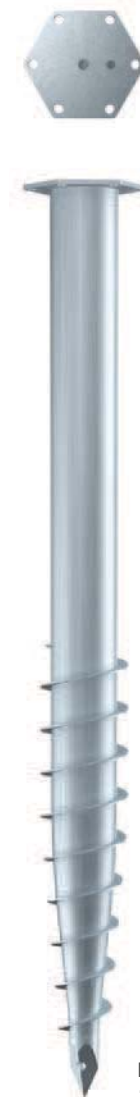
KSF M 76x 1000-M12