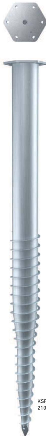
KSF M 140x 2100-M24