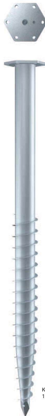
KSF M 89x 1600-M24